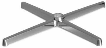
DB1. 8 Four Star Base