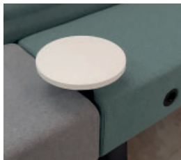
Mr.BOX høy modulsofa